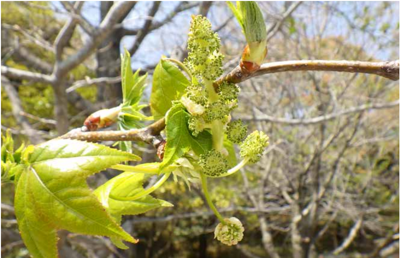
モミジバフウの花