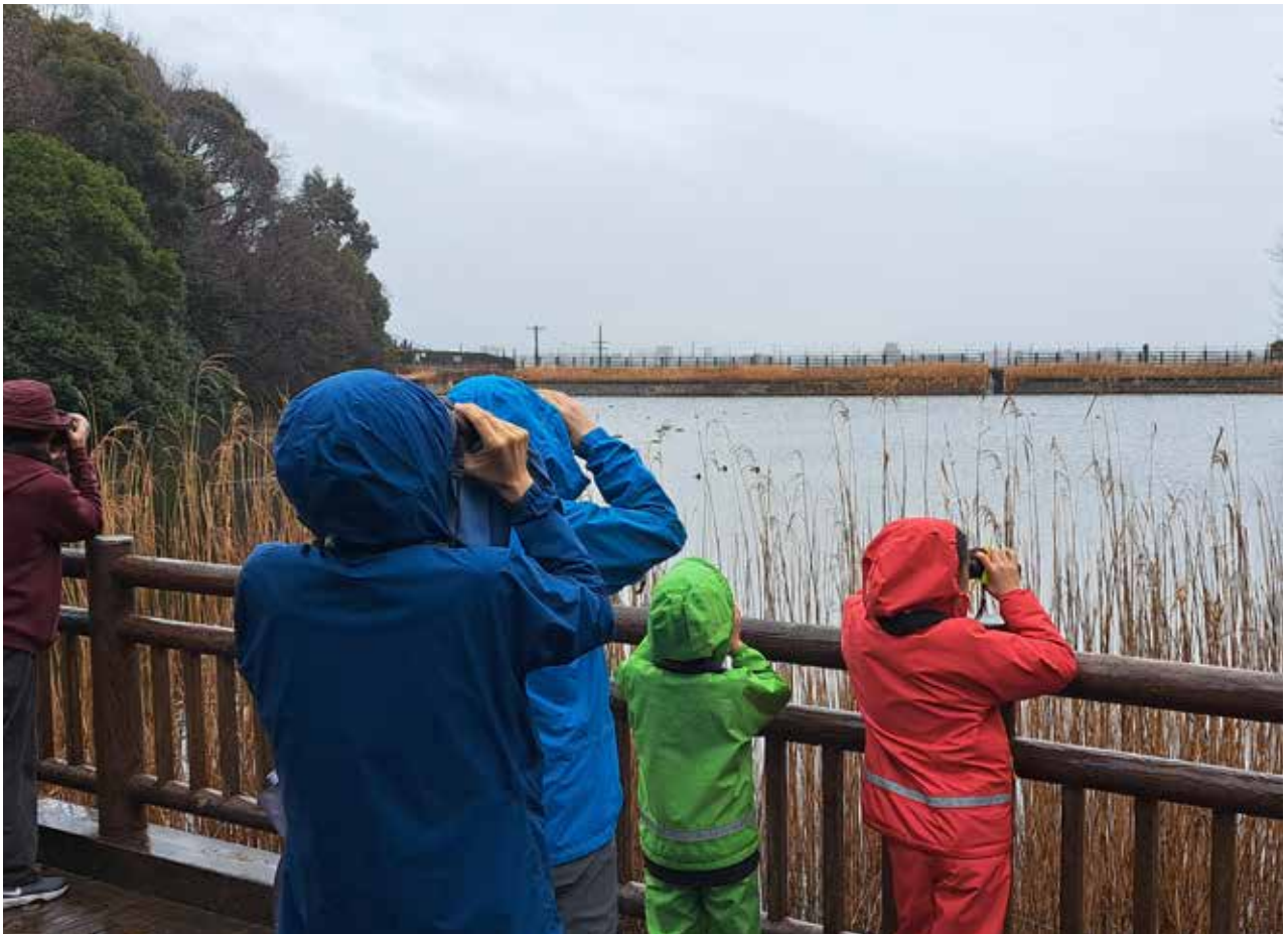
赤塚山公園自然観察会「バードウォッチング」