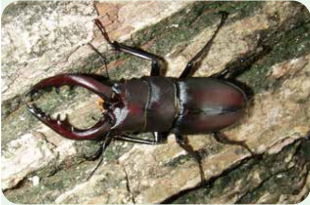
ノコギリクワガタ Prosopocoilus inclinatus inclinatus 体長：オス 30~75mm、メス 25~40mm。 ノッコーと呼ばれ、大きなものは人気があります。