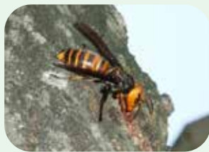
スズメバチのなかま