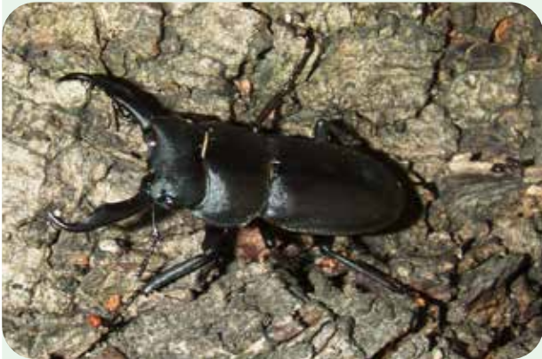
コクワガタ Dorcus rectus rectus 体長：オス 20~50mm、メス 20~30mm。 オスをコックー、メスをブーチャンやマンルーと呼び、赤塚山公園では比較的簡単に見られます。