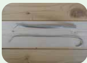
②ピンセットやハリガネ