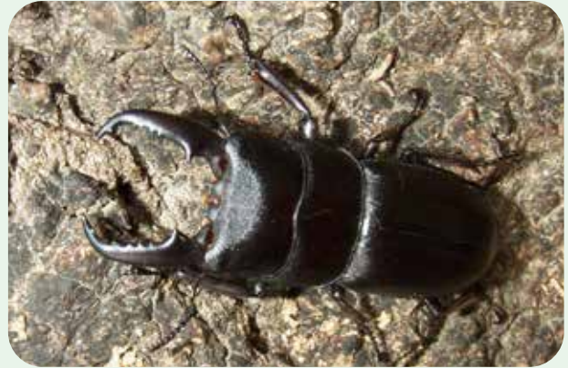
ヒラタクワガタ Dorcus titanus pilifer 体長：オス 25~75mm、メス 20~40mm。 赤塚山公園の黒いダイヤ、見られたら幸運です。