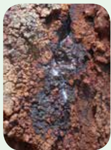
蜜が出ている場所