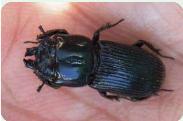
チビクワガタ Figulus binodulus 体長：オス 10~15mm、メス 10~15mm。 赤塚山公園では、珍しいです。

赤塚山公園は園路脇でもクワガタを見られる場所があり、はじめてのクワガタ探しには、もってこいの場所です。また、ここで紹介したチビクワガタは、豊川市内ではいないとされていましたが、2011年6月19日に赤塚山公園内で初確認されました。このほか、豊川市内ではミヤマクワガタやスジクワガタも確認されていますので、探したら赤塚山公園でも見られるかもしれません。