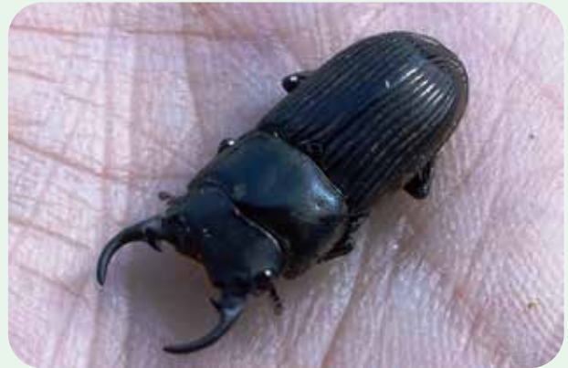
ネブトクワガタ Aegus laevicollis subnitidus 体長：オス 15~30mm、メス 15~25mm。 赤塚山公園では、珍しいです。