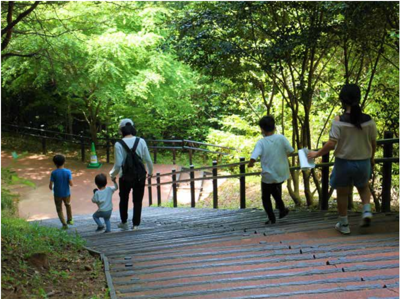
赤塚山公園クイズ