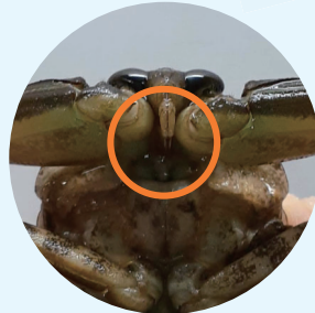
タガメの棘状の口