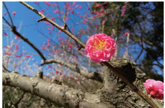
淋子梅(りんしばい)

梅まつりは、2月10日から3月15日まで開催しております。期間中の土日祝日には、豊川観光物産展も行っています。また、今年は、第1駐車場およびぎょぎょランド前を工事しておりますので、お気をつけてご通行ください。