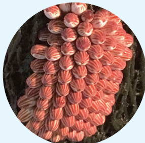
杭に産み付けられた卵塊