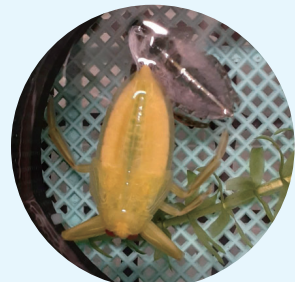
脱皮したばかりの幼虫 神々しい黄色をしている