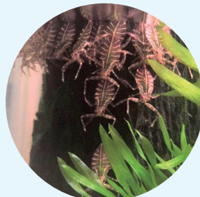
孵化したばかりの幼虫