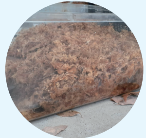
ミズゴケの中で冬眠中のタガメ

今回の特集は、冬ではありますが、アクアギャラリーIIの人気生物で昆虫少年の憧れ、タガメです。2018年のリニューアルから地域の水生昆虫を展示していますが、中でもタガメは、少年たちだけでなく、私のようなかつての少年の心をも捉える一番の人気者となっています。こどもたちの声に混じり、時折同世代の方からの興奮めいた「なつかしい!」とお声を聞くことができます。