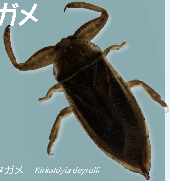
タガメ Kirkaldyia deyrolli